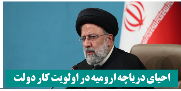
احیای دریاچه ارومیه در اولویت کار دولت