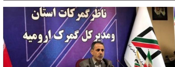
ناظر گمرکات استان و مدیر کل گمرک ارومیه