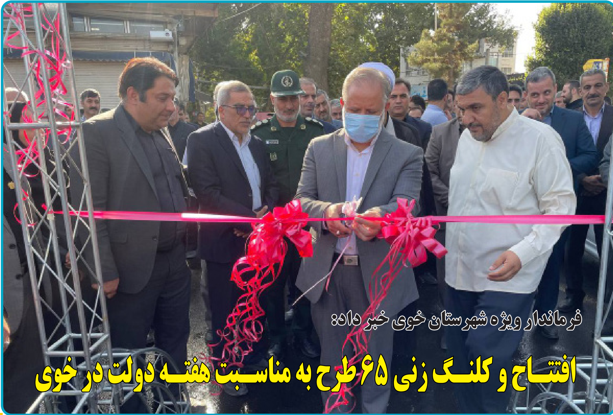
فرماندهار ویژه شهرستان خوی خیر ۵۱۵۸