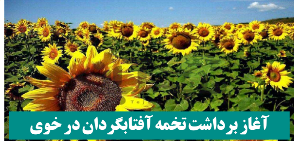
آغاز برداشت تخمه آفتابگردان در خوی