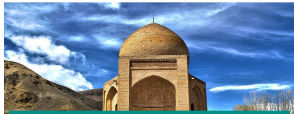
برگزاری اولین پاسداشت حماسه چالدران

۳ شهریور ماه ۱۴۰۱ / ۲۷ محرم ۱۴۴۴ / ۲۵ آگوست ۲۰۲۲