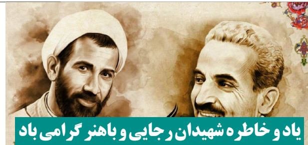
یاد و خاطره شهیدان رجایی و باهنر گرامی باد

هفته نامه الکترونیک غیر برخط آذربان - سال اول - شماره پنجم / بها: ۵۰۰۰۰ ریال